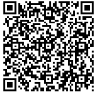
スマートフォン用

スマートフォンまたは携帯電話の場合、次のQRコードを読み取って申し込むこともできます。